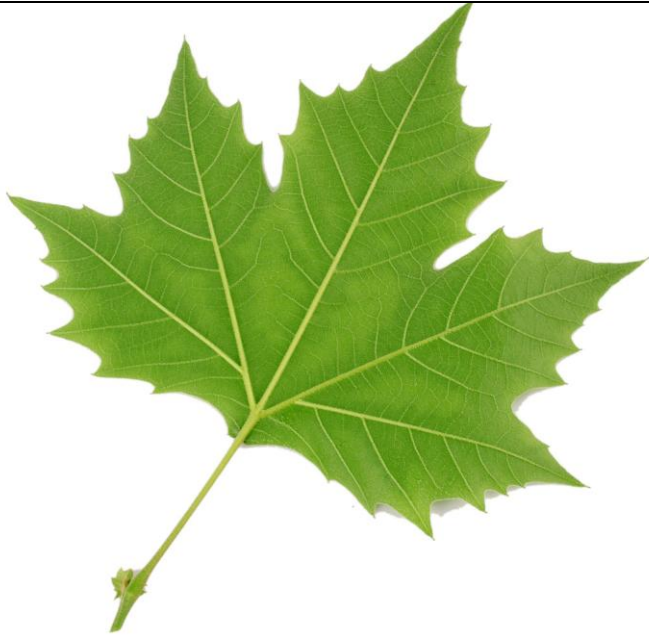
Les feuilles du platane sont alternes et peu dentées.