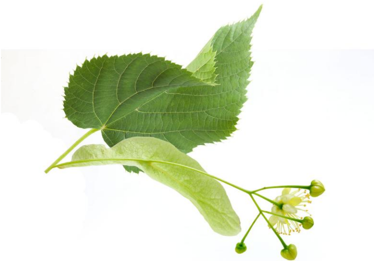
Les feuilles du tilleul sont simples et alternes.