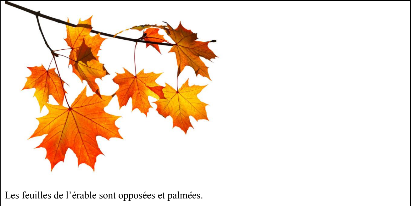
Les feuilles de l'érable sont opposées et palmées.