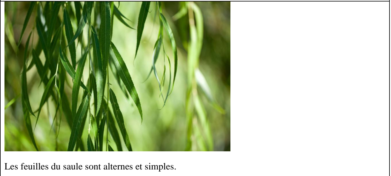
Les feuilles du saule sont alternes et simples.