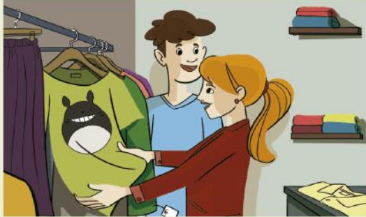
1 Ils cherchent un cadeau pour l'anniversaire d'un copain.